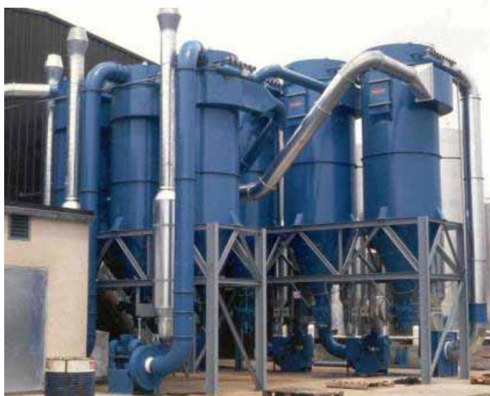
SimPact 4T puls-jet filter filtrerar marmor-, glas- och polyesterstoff hos S.T.D. i Frankrike

Som option erbjuds en utvidgad styrenhet, som är utrustad med en differenstryckstransducer, som gör det möjligt att avläsa tryckfallet på styrenhetens LED-display. Den utvidgade styrningen kan anpassa rensssekvensen efter tryckfallet och hålla tryckfallet konstant. Därmed reduceras tryckluftsförbrukningen och sänker emissionsvärdena.